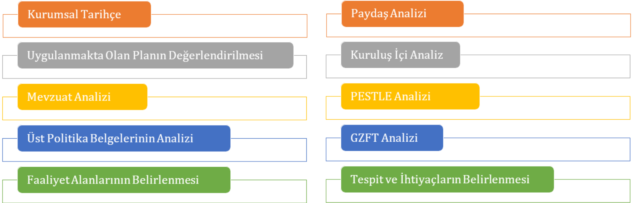
Şekil 1. Durum Analizi Çalışmaları